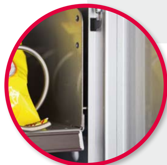
Particolare bloccaggio cassette.