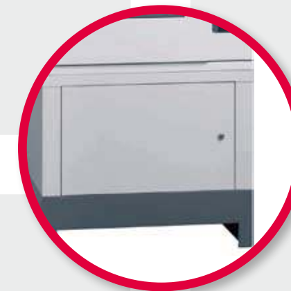
Mobile di supporto.