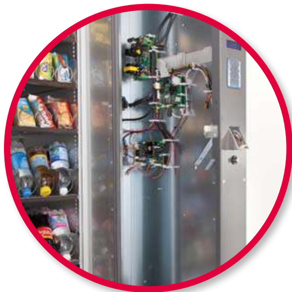
Pannello di controllo interno estraibile.