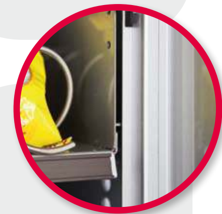
Particolare bloccaggio cassette.