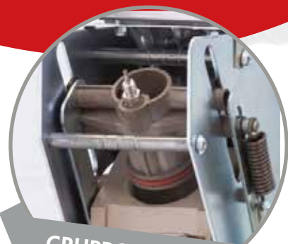
GRUPPO INFUSORE PRERISCALDATO