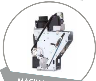
MACINA CAFFÈ A LAME CONICHE