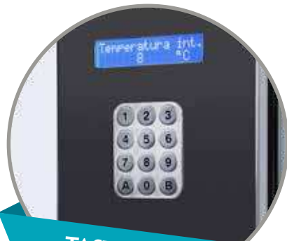
TASTIERINO IN ACCIAIO INOX

■ Snack ■ Bottiglia PET 0,5 l ■ Lattina 33cl